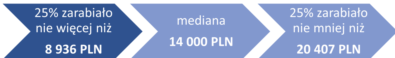
Schemat 1. Wynagrodzenia absolwentów MBA w 2022 roku (brutto w PLN)